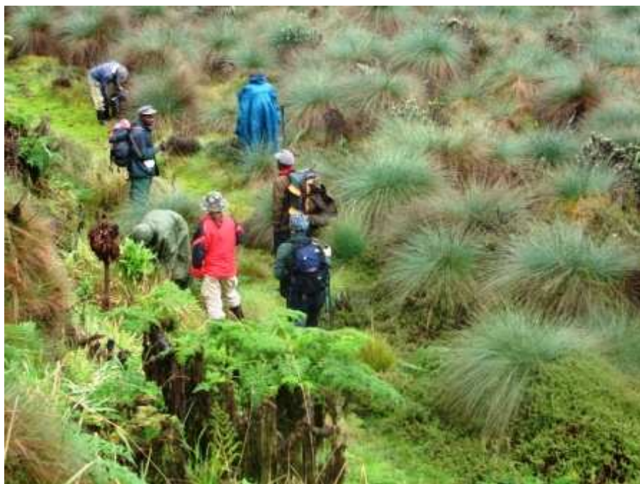
Pochod v bažinách, foto: David Zoufalý

Sazba vstupného (je různá pro Afričany a ostatní cizince) se pohybuje ve stovkách dolarů na osobu. Pro rozpočet naší expedice je uvažována částka 700 USD za osobu (jedná se sazbu ověřenou v roce 2006, která zahrnuje vstup do parku, průvodce, 4 nosiče, ubytování – shelter, poplatky za palivo). Pro výstup na vrchol Margherita Peak je nutná horolezecká výzbroj (cepíny, mačky, lana..)