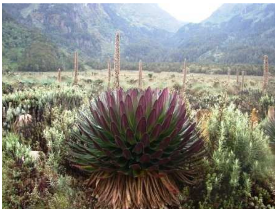
Lobélie a nikde nekončící, stále přítomné bažiny a vřesoviště, foto: David Zoufalý